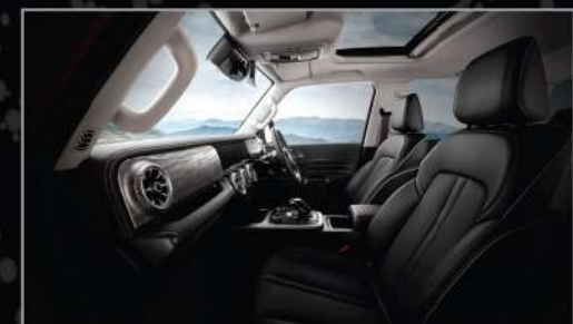
ULTRA / Black