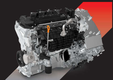
1.5L HYBRID ENGINE เครื่องยนต์ 1.5 ลิตร ทำงานร่วมกับมอเตอร์ไฟฟ้า ให้กำลังสูงสุด 190 แรงม้า และแรงบิดสูงสุด 375 นิวตัน-เมตร

SMOOTH เร่งแรง ไม่สะดุด EFFICIENCY พลังเต็มประสิทธิภาพ ตอบสนองในทุกการขับขี่